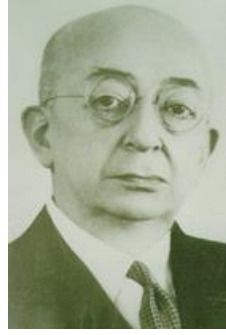
Dr. Refik SAYDAM (1881-1942)