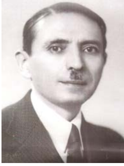
Dr. Hulusi BEHÇET (1889-1948)