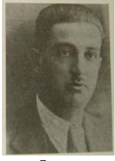
Eczacı Süleyman Ferit Eczacıbaşı (1886-1973)