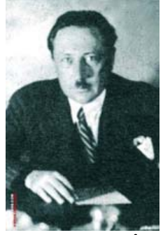
Dr. Reşit GALİP (1897-1934)